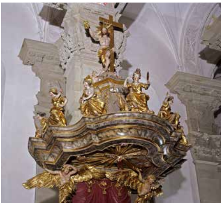
Schloss Langenburg / Kanzel in der Stiftskirche St. Nikolaus