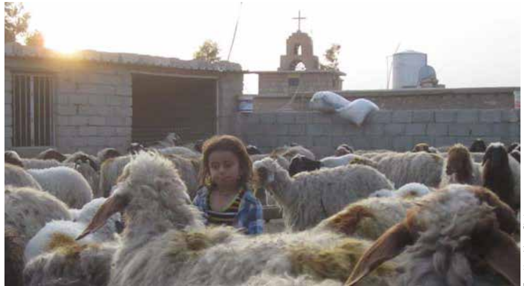
Ein Mädchen hütet Schafe in der Ninive-Ebene.